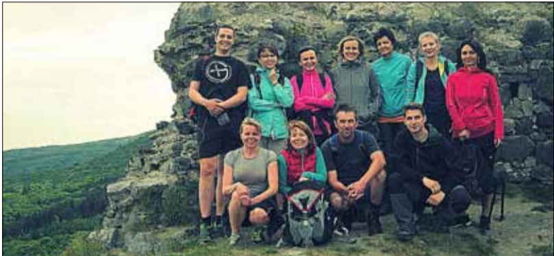
Na zřícenině hradu Oltářík (Hrádek).

zení a ubytování v hospůdce v Dřemčicích. Druhý den se pokračovalo výstupem na zříceninu Ostrý a do Opárna (cca 20 km). Po cestě nás kromě návštěvy hradů a krásné přírody čekala ještě zastávka u našeho kolegy „včeláře“. Všem se putování moc líbilo a už plánujeme další. ©