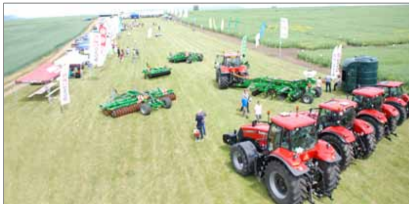
Prezentace firem, ukázky techniky, setkání s odborníky - to vše je v Radovesicích již tradicí.

Dne 2. 6. 2015 se uskutečnil již tradiční POLNÍ DEN na letišti u Radovesic. Na programu byly prohlídky demonstračních pokusů spojené s diskusí s odborníky na témata: odrůdy řepky ozimé, pšenice ozimé, systémy výživy, podzimní hnojení, doplňková výživa, přihnojení pod patu. Dále bylo možno shlédnout výstavu zemědělské techniky, navštívit stánky výrobců hnojiv, osivářských firem a dodavatelů pesticidů. Pro zájemce bylo možno vystoupit i na nedalekém hradě Hazmburk. I přes vydatný noční déšť se počasí nakonec umoudřilo a akce byla více než úspěšná.