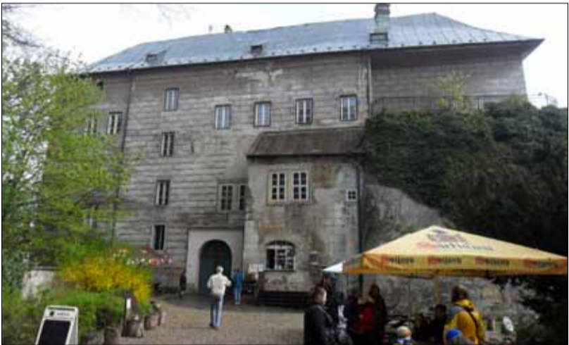
Nádvorí hradu Houska.

Proti našim zvyklostem vyrazíme na další náš společný výlet autem. A i když budeme cestovat po asfaltových cestách často plných výmolů, stihneme toho během příjemného letního dne mnohem víc, než kdybychom použili pouze veřejnou dopravu. Navíc peklo na vesnických silničkách bude pouze přípravou na návštěvu našeho dnešního hlavního cíle, místa kde se snad opravdu v minulosti otevřela brána do pekla.