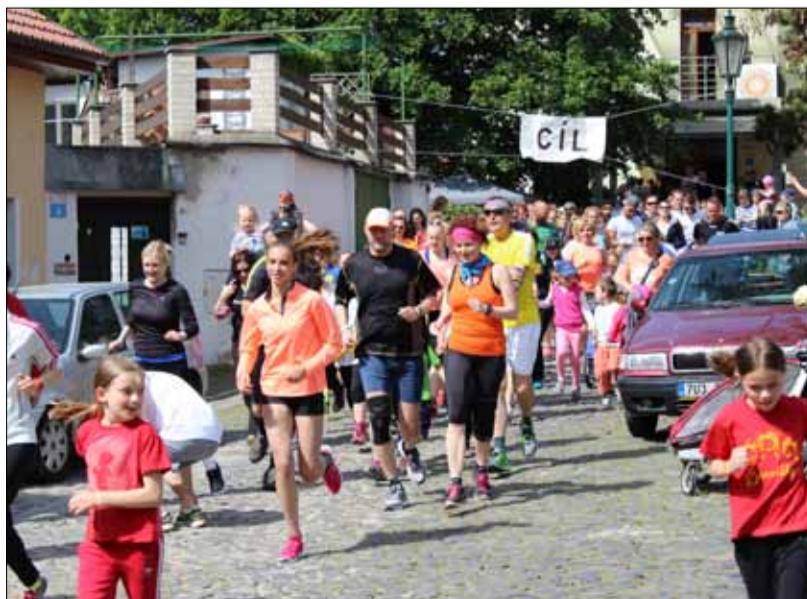
Běží i PREOL.

Litoměřický Hospic sv. Štěpána uspořádal další benefiční akci za účelem získání finančních prostředků na zajištění péče o seniory. Tentokrát se jednalo o počín běžecký či chodecký s názvem „Běžíme jako o život“. Zájemci mohli vydražit i dresy hráčů HK Města Lovosic, finalistů letošního mistrovství ČR. V nabídce byly trasy na jeden, tři a deset kilometrů. Zúčastnit se mohl kdokoliv, nejkratší trasa byla určena (nejen) pro maminky s kočárky a malými dětmi, nejdelší trať, kde nejvzdálenějším bodem byla Třeboutická malá vodní elektrárna, kterou si vybralo téměř sto běžců. Kromě veřejnosti a lovosických extraligových házenkářů se mezi běžci objevili i zástupci PREOL. Vládla dobrá nálada a hlavně počasí nám přálo na běh přesně akorát.