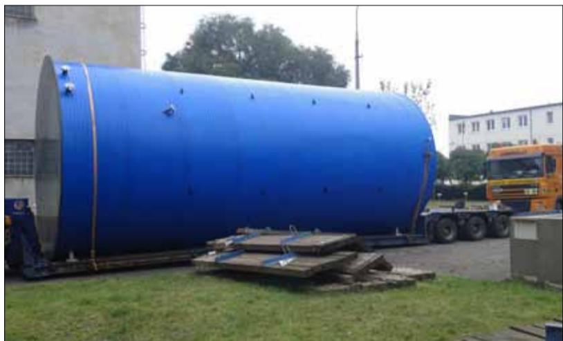
Nádrž AdBlue - 150 m 3 .