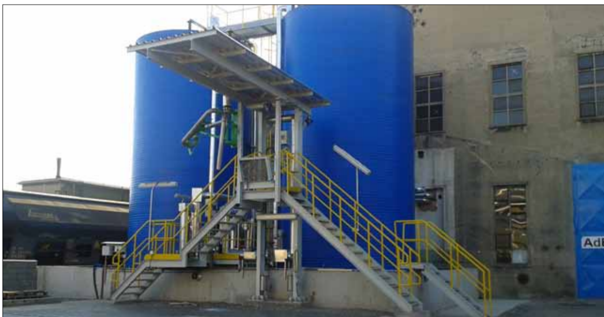
Dokončená stavba AdBlue.