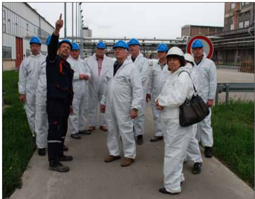
Dne 20. 5. navštívili Lovochemii zákazníci AgroZZN Rakovník. Po úvodní prezentaci o naší společnosti si prohlédli nejen výrobu LAV III a sklady hotových výrobků, ale také celý areál našeho podniku. Vzhledem k tomu, že se jednalo o konečné spotřebitele našich hnojiv, zajímali se především o novinky v našem sortimentu, kapacity nakládky a možnosti balení. Návštěvníci byli velmi spokojeni.