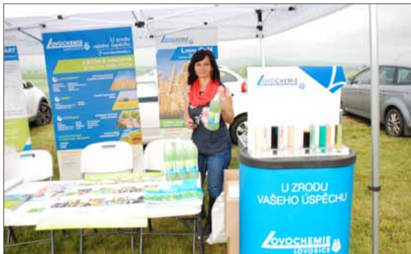
Stánek společnosti Lovochemie.