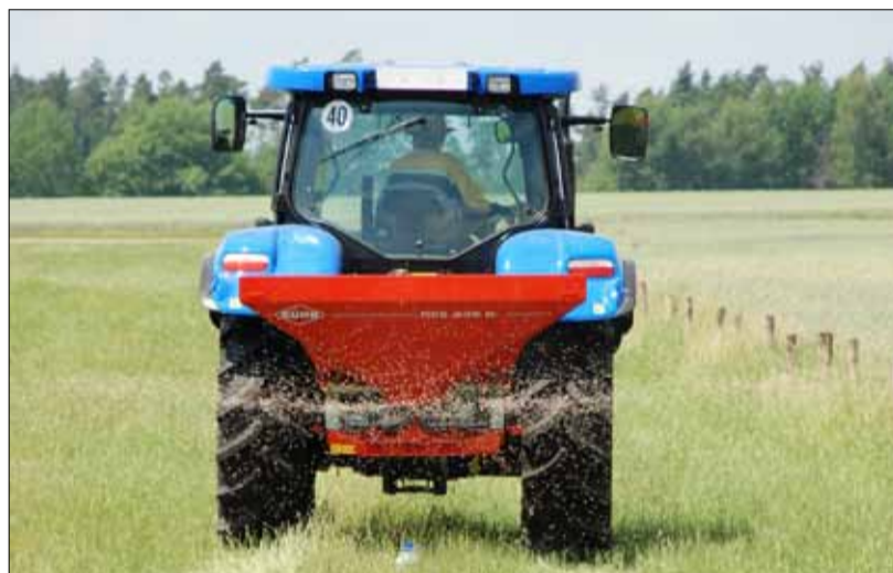
Rozmetání hnojiva LAD.