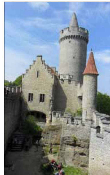
Hradní věž na Kokoříně.

A již je tady tolik očekávaná prohlídka hradu a hlavně kaple, s nedávno objevenými freskami a pod kterou by měla být puklina vedoucí do pekla. Zatímco průvodce na Kokoříně nás možná trochu nudil, na Housce se určitě nudit nebude-