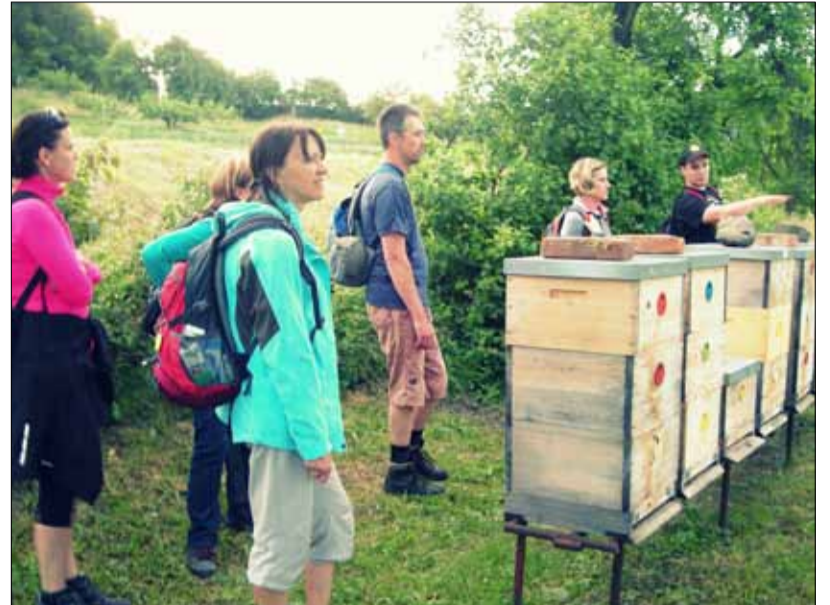
Odborný výklad o včelařství ©.