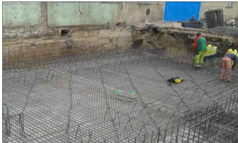
Výztuž dna záchytné vany.

v původním záměru uvažováno. Součástí nově zbudovaného venkovního skladu je také nové, plně automatizované stáčení a expedice do autocisteren. Kapacita expedice AdBlue je 65 m 3 (cca 65 tun) za hodinu. Standardně používaný typ autocisterny je tak možné vyexpedovat do maximálně 30 minut. Výhodou je fakt, že podobně jako na jiných expedičních místech v Lovochemii (např. na expedici DAMu), je možné expedit absolutně bez přítomnosti obsluhy.