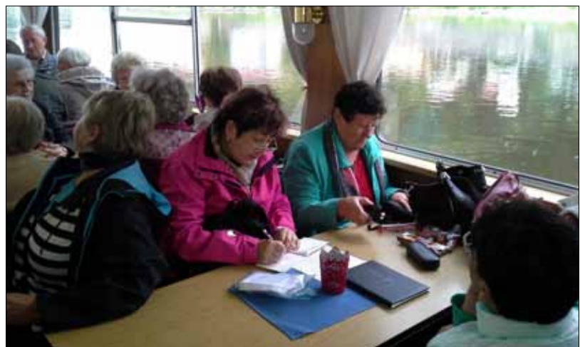
Poslední přípravy před plavbou.

Všichni účastníci plavby děkují vedení podniku za možnost uskutečnění této akce s potěšením, že na své bývalé zaměstnance nezapomínají.