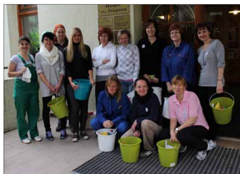
Parta pracovníků PREOL v akci „Myjeme jako o život“.

Zaměstnanci PREOLu nezůstali jen u chůze a běhu. K dílu přidali také dvanáct párů rukou a na sportovní akci hospice „Běžíme jako o život“ navázali vlastní, neméně fyzicky náročnou akci, „Myjeme jako o život“. S nasazením maratonských běžců hravě umyli všech 158 oken historické budovy hospice. Možnostem, jak podpořit dobrou věc, se meze nekladou ☺