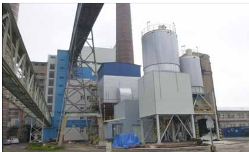
Technologie čištění spalin a síla popílku.

To byl ale jen stručný výčet činnosti za minulé období. Ve skutečnosti bylo provedeno mnohem více, stavba je prakticky dokončena a oba zhotovitelé se plně věnují odstraňování nedodělků.