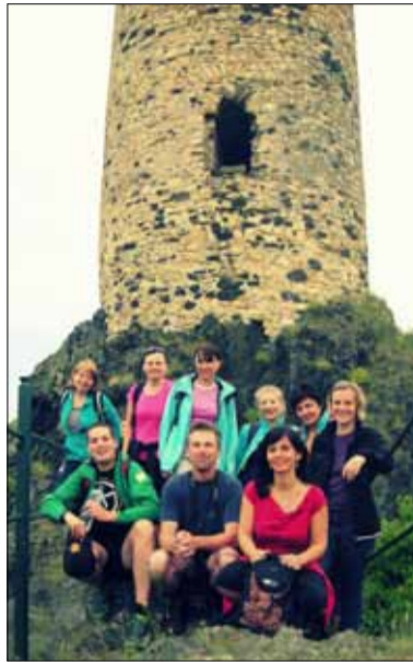
Zřícenina hradu „Skalka“.