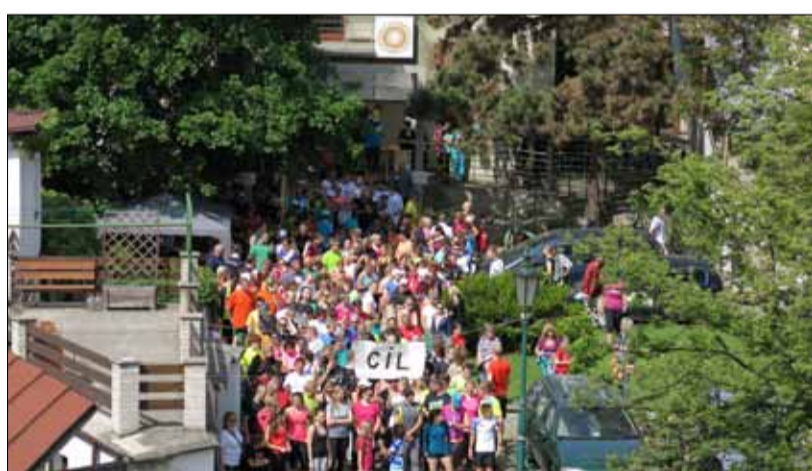
Start akce „Běžíme jako o život“.

Litoměřický Hospic sv. Štěpána uspořádal další benefiční akci za účelem získání finančních prostředků na zajištění péče o seniory. Tentokrát se jednalo o počín běžecký či chodecký s názvem „Běžíme jako o život“. Zájemci mohli vydražit i dresy hráčů HK Města Lovosic, finalistů letošního mistrovství ČR. V nabídce byly trasy na jeden, tři a deset kilometrů. Zúčastnit se mohl kdokoliv, nejkratší trasa byla určena (nejen) pro maminky s kočárky a malými dětmi, nejdelší trať, kde nejvzdálenějším bodem byla Třeboutická malá vodní elektrárna, kterou si vybralo téměř sto běžců. Kromě veřejnosti a lovosických extraligových házenkářů se mezi běžci objevili i zástupci PREOL. Vládla dobrá nálada a hlavně počasí nám přálo na běh přesně akorát.