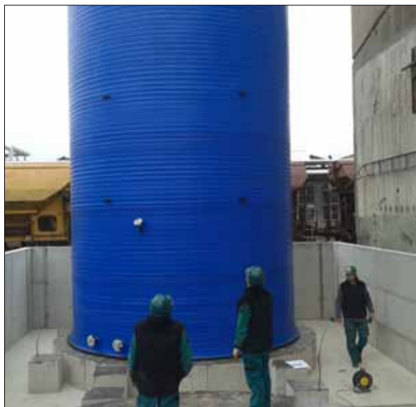
Instalace nádrže na pozici.