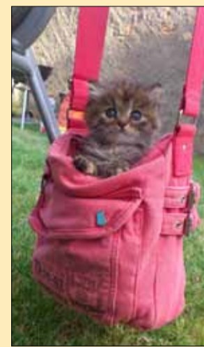
Vítězný snímek z loňského roku na téma „Léto s mazlíčkem“.

Na Vaše fotografie se těší a krásné letní dny s Lovochemikem přeje Vaše redakční rada!