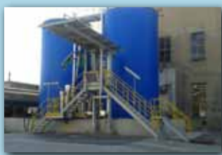
NOVÝ SKLAD A EXPEDICE ADBLUE