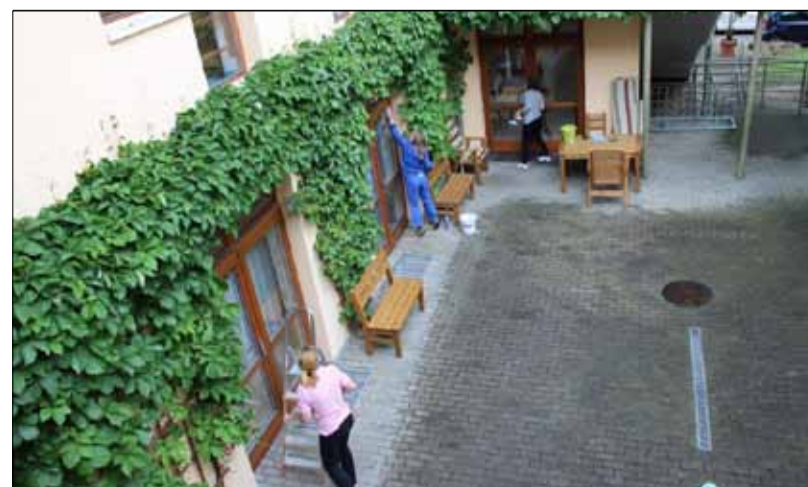
A za chvíli máme hotovo.