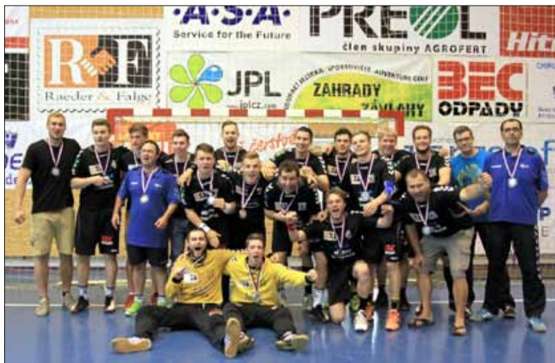
Vícemistr ČR v házené.

Po odpočinku se družstva začnou připravovat v červenci na další sezónu. Těšíme se, jak si povedou a čím potěší svoje fanoušky!