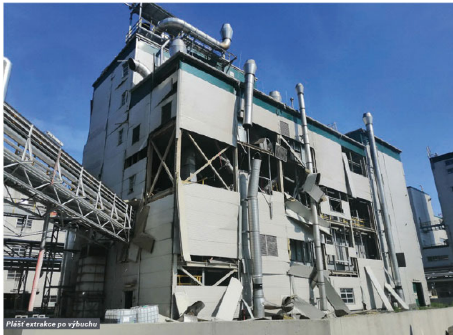
Plášť extrakce po výbuchu

Nadpis článku je trochu upravený citát původně vyřčený Johnem Swigertem a Jimem Lovellem při misi Apolla 13 a je zde záměrně použitý. Čeká vás článek, který bude popisovat kroky a postupy po mimořádné události ve společnosti, jež se stala dne 5. 7. 2021. Pokračování naleznete v dalším čísle novin.