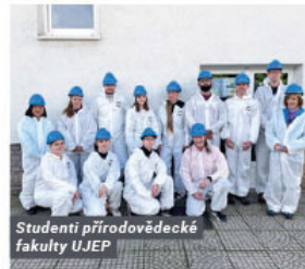
Studenti přírodovědecké fakulty UJEP

Program exkurzí byl vždy navržen na míru pro jednotlivé obory. Studenti z oboru opravář zemědělských strojů navštívili naše dílny a zároveň oddělení expedice, kde jim bylo odborně popsáno co se na tomto oddělení s výrobky děje. Další studenti byli z maturitního oboru aplikované chemie a zaměřili do laboratorní a na vodní hospodářství, kde jim bylo umožněno nahlédnout do procesů úpravy vody, které nejsou veřejnosti dostupné a udělat si tak povědomí o tom, jak by jejich budoucí zaměstnání mohlo vypadat. Studenti z příro-