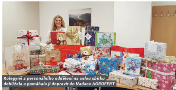
Kolegyně z personálního oddělení na celou sbírku dohlížela a pomáhala ji dopravit do Nadace AGROFERT

Ve spolupráci s Nadací AGROFERT se již osmým rokem zaměstnanci Lovochemie a PREOL zapojili do dobročinné sbírky vánočních dáreků pro děti rodičů samoživitelů či rodin v tíživé životní situaci.