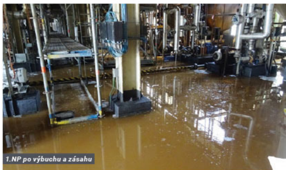
1.NP po výbuchu a zásahu

Když jsem ráno 6. 7. 2021 po mimořádné události dorazil během státního svátku do areálu, moc jsem netušil, co se vlastně stalo, ale z prvního pohledu na výrobu Extrakce bylo jasné, že nás