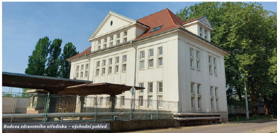
Budova zdravotního střediska – východní pohled.

Je to již pár měsíců, co byl objekt zdravotního střediska úspěšně zkolaudován a mohl být znovuotevřen široké veřejnosti s cílem poskytovat kvalitní zdravotnické služby v novém moderním a bezbariérovém prostředí a to jen pár kroků od hlavní vrátnice Lovochemie. Na kolik se toto podařilo, nechám na posouzení každého návštěvníka samostatně, ale rád bych se vrátil k samotné přípravě a realizaci této nevědní investiční akce.