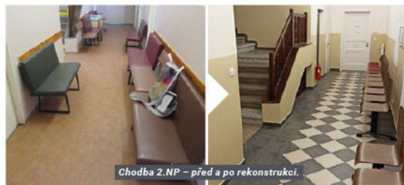
Chodba 2.NP – před a po rekonstrukci.

prostory. Jak jistě víte, dočasným působištěm pro ordinace ORL, praktického lékaře a rehabilitace se stala budova závodní jídelny, kam byly po drobných úpravách v říjnu téhož roku přestěhovány. Lékárna svou činnost v budově prozatím přerušila. Nic tedy již nebránilo předat 1. listopadu roku 2021 staveniště vybranému zhotoviteli Zemědělským stavbám Ústí nad Labem, a.s.