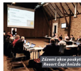
Zázemí akce poskytl Resort Gapi hnízdo.

Odpolední blok prezentací byl dedikován představení přístupů a vý-