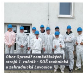
Obor Opravář zemědělských strojů 1. ročník - SOŠ technická a zahradnická Lovosice

Tímto bych ráda poděkovala za spolupráci a odborné vedení kolegům, kteří se na exkurzích podíleli a umožňují tak nahlédnout studentům do naší každodenní práce.