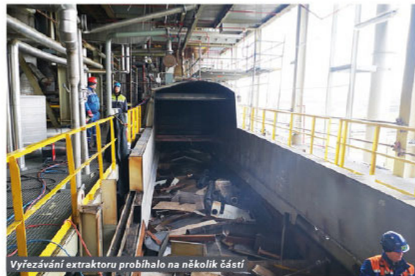
Vyřezávání extraktoru probíhalo na několika částí

tiky objektu při vlastní výstavbě, jsme zajistili stav statiky objektu a získali doporučení k dalšímu postupu. Z důvodu dodržení bezpečnosti následovala organizovaná demontáž celého opláštění objektu, což chvílemi připomínalo činnosti, které mnohdy vidíme v televizních zprávách při likvidaci následků živelných událostí.