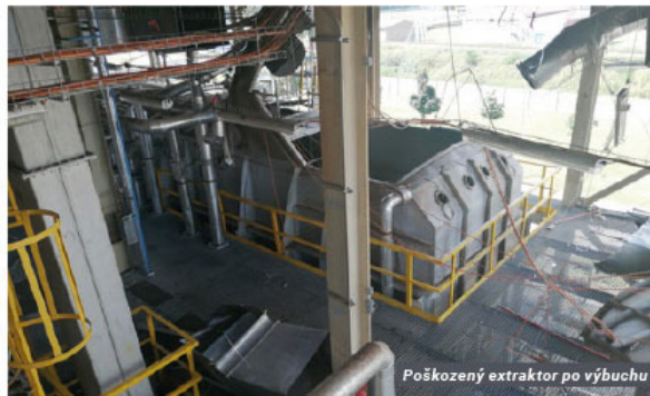
Poškozený extraktor po výbuchu