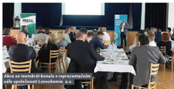
Akce se tentokrát konala v reprezentačním sále společnosti Lovochemie, a.s.

Dne 15. 11. 2022 jsme opět mohli po téměř tříleté „covidové“ pauze v reprezentačním sále společnosti Lovochemie přivítat účastníky z řad představitelů měst a obcí, institucí státní správy z Ústeckého kraje, zejména z odborů životního prostředí, ochrany vod a ovzduší, hygienické stanice, HZS, úřadů práce či Povodí Labe.