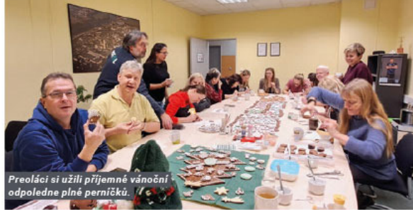
Preoláci si užili příjemné vánoční odpoledne plné perníčků.

K vánoční atmosféře neodmyslitelně patří perníčky a tak jsme 30. 11. 2022 pro naše kolegyně a kolegy z PREOLu uspořádali tvořivé voňavé odpoledne.