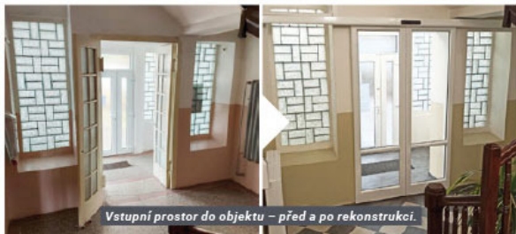
Vstupní prostor do objektu – před a po rekonstrukci.

V rekonstruované budově tak naleznete v přízemí ordinaci ORL, první patro slouží celé rehabilitaci, která byla nově rozšířena o část vodoláčeb. V posledním patře jsou již obsazené obě dvě ordinace praktickými lékaři. V současné době připravuje nájemce lékárný znovuotevření. Lovochemie dále nabízí k pronájmu v přízemí poslední volný prostor. Máme také vypracovaný navazující projekt na malé parkoviště pro zdravotní středisko, které by mohlo vzniknout na východní straně objektu zbouráním starého strážního domečku a části kolárny. O jeho případné realizaci Vás ale budeme více informovat v jiném článku. Poděkování patří samozřejmě všem kolegům, kteří se jakkoliv podíleli na průběhu celé akce, dále zhotoviteli rekonstrukce, projekčním kancelářím a v neposlední řadě, nájemcům.