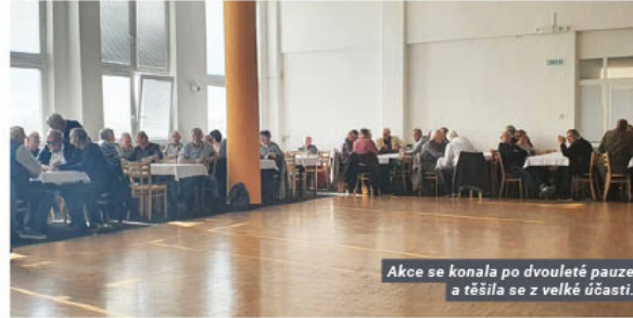
Akce se konala po dvouleté pauze a těšila se z velké účasti.

Po otevření a vstupu byli důchodci mile uvítáni a byl jim předán poukaz na jim oblíbené hnojivo, které si mohou vyzvednout po Novém roce.