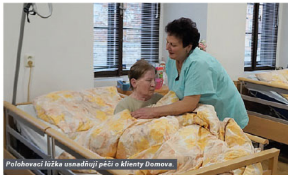
Polohovací lůžka usnadňují péči o klienty Domova.

Společnost Lovochemie dlouhodobě podporuje Charitní domov svaté Zdislavy v Litoměřicích a každý rok věnuje finanční prostředky na jeho provoz a vybavení.