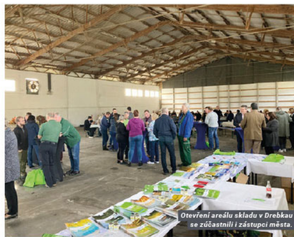
Otevření areálu skladu v Drebkau se zúčastnili i zástupci města.

S využitím potenciálu AGFD a AGROFERT Polska pro skladování a následnou distribuci agrárních komodit bude středisko v Drebkau počínaje novou sezónou 2023 významným subjektem na trhu.