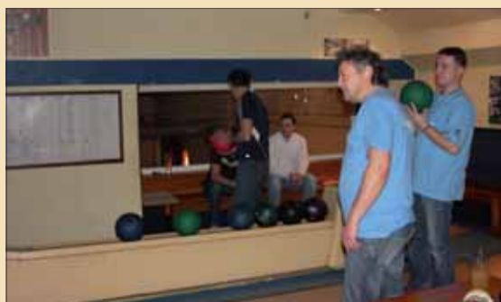
Za Lovochemii startovalo pět mužských týmů.