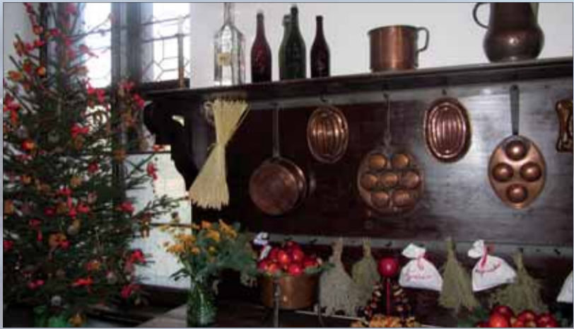
Vánočně vyzdobená kuchyně.