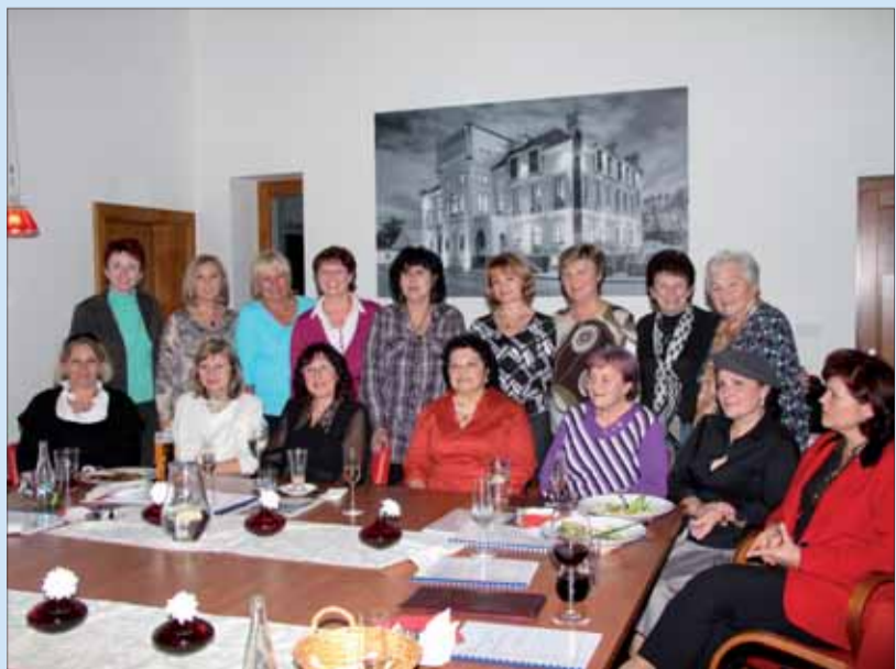
Téměř v plném počtu.

První ročník setkání bývalých sekretářek a asistentek podniků Severočeské chemické závody a Lovochemie se uskutečnil letos v říjnu v příjemné atmosféře hotelu Lev v Lovosicích. Některé asistentky se neviděly dlouhá léta, a tak setkání sklídilo nebývalý úspěch!