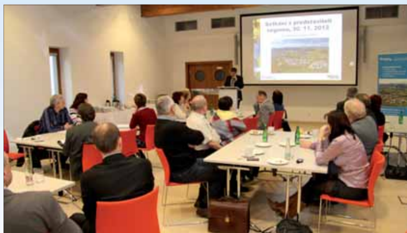
Setkání se konalo již podruhé a bylo příjemnou příležitostí k projednání mnoha témat.

PREOL se v letošním roce soustředil na navýšení lisovací kapacity řepky a přípravu projektu PREOL FOOD, který je zaměřen na novou výrobu rostlinných jedlých olejů, které budou určeny pro malospotřebitelský trh. Dojde tak k rozšíření stávajícího portfolia produktů společnosti PREOL, přičemž projekt samotný vytvoří 30 nových pracovních míst. V roce 2013 bude dále v surovině PREOL dořešena problematika reziduální pachové zátěže, která vzniká při ohřevu řepky, a to prostřednictvím ekologické investice do nové progresivní technologie „Cold Plasma“.