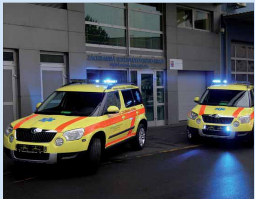
Vánoční dárek pro ZZS ÚK.

Přejeme zdravotníkům, ať jim vozy slouží k všeobecné spokojenosti co nejdéle a jsou vždy ve správný čas na správném místě. ■