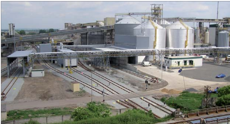
Za podpory Strukturálních fondů EU byla pro potřebu společnosti PREOL rozšířena železniční vlečka. 30. dubna byla uvedena do zkušebního provozu.

Jak jsme všichni zažili na vlastní kůži zejména během zimních měsíců, stavba nové jednotky MEŘO společnosti Preol s sebou přináší spoustu komplikací spojených s pořádkem v našem areálu. Tyto komplikace se dotkly zejména provozních zaměstnanců. Rád bych zde všem poděkoval za obrovskou trpělivost. Jak se pomalu blíží stavba jednotky MEŘO do finále, začíná generální dodavatel stavby, společnost Chemoprojekt, pomalu slyšet i na naše požadavky týkající se úklidu. Nicméně bude ještě nějaký čas trvat, než se vše vrátí do původního stavu.