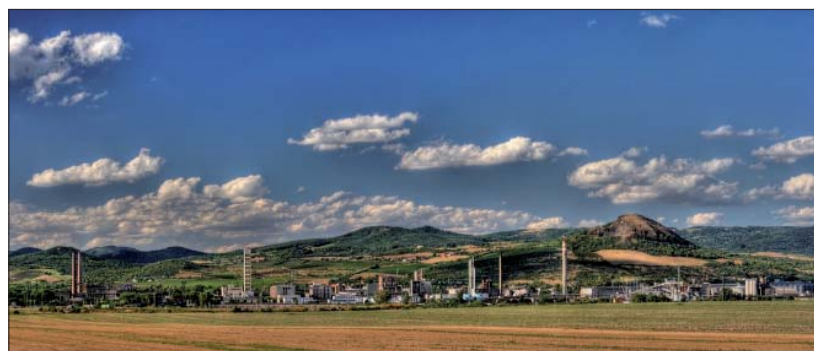
Panoráma areálu Lovochemie.

Že nejde pouze o jednorázovou akci, dokazuje i vydání publikace s těmito fotografiemi, kterou však nelze zakoupit, a proto si myslím, že bude zajímavým sběratelským kouskem. Fotografie si ale můžete prohlédnout i na www.fabrica-bohemica.cz. ■