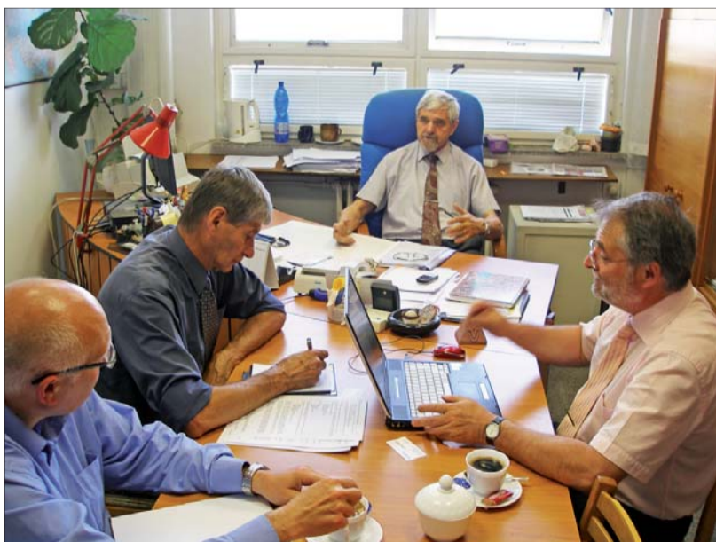
Auditoři TÜV Nord Czech prověřují u vedoucího OVR proces „Vývoj“.